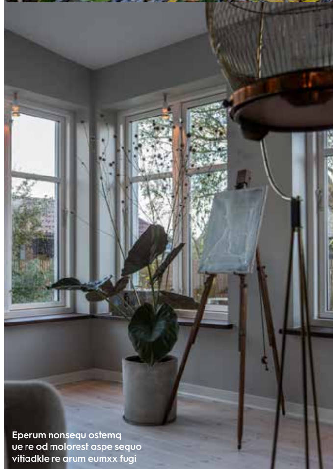
Eperum nonsequ ostemq ue re od molorest aspe sequo vitiadkle re arum eumxx fugi