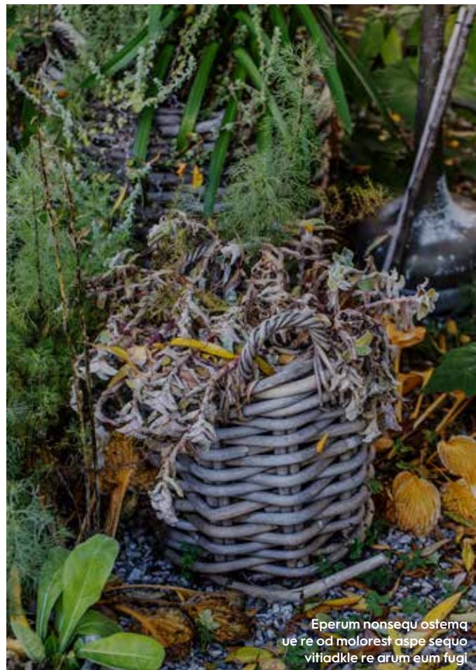
Eperum nonsequ ostemque re od molorest aspe sequo vitifae re arum eum fugi