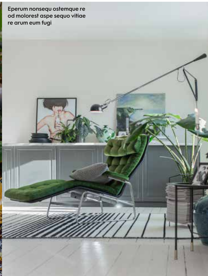
Eperum nonsequ ostemq ue re od molorest aspe sequo vitiadkle re arum eumx fugi